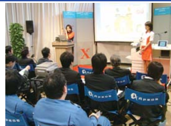
ITソリューションフェアin新潟2006の様子